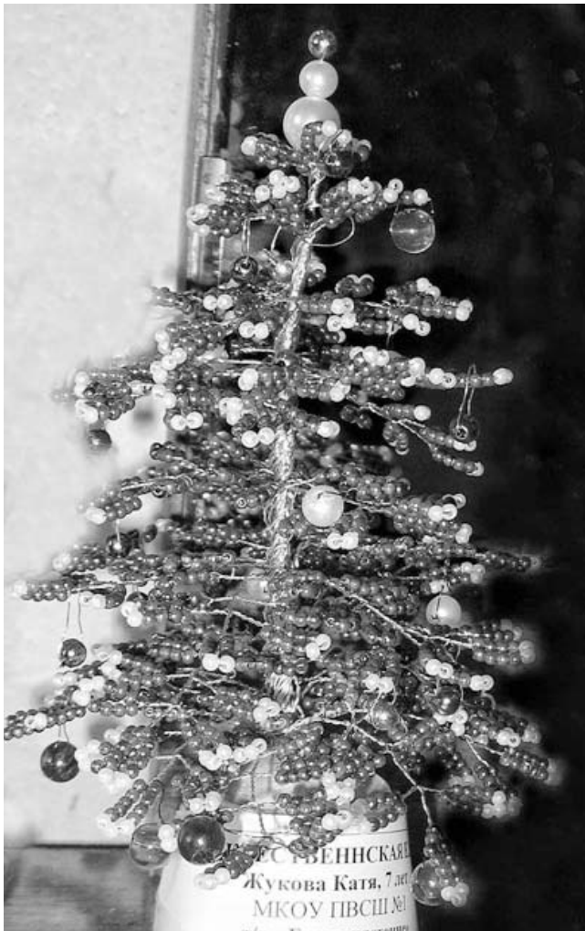
Елочка из бисера.