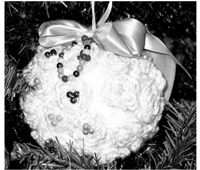
Шар, связанный крючком.