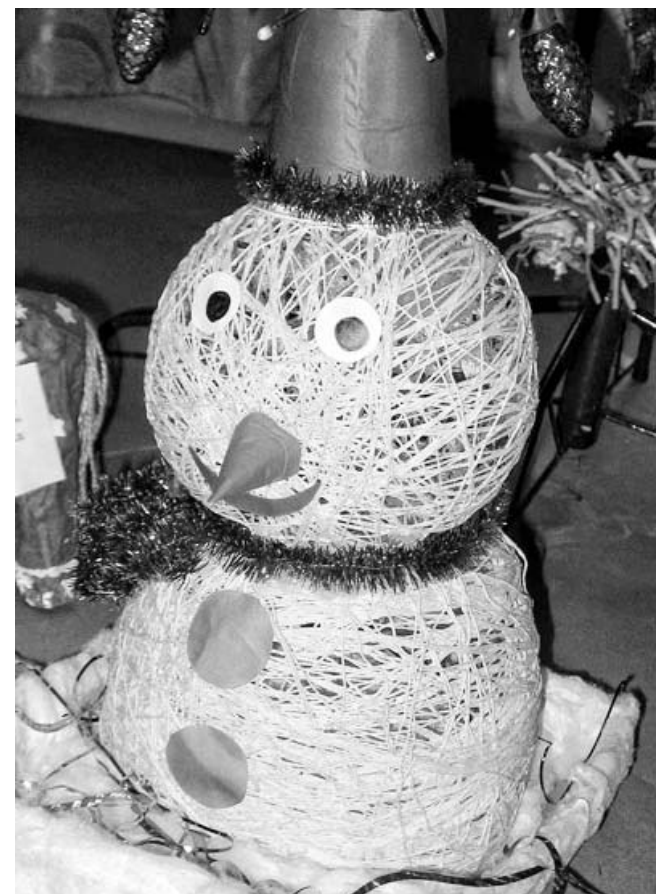
Снеговик из ниток.