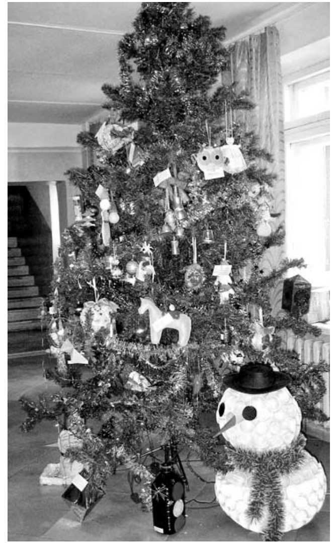
Новогодняя елка в фойе администрации района, украшенная игрушками, сделанными конкурсантами.